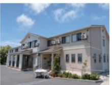
有料老人ホーム コスモスの家田尻 〒598-0091 大阪府泉南郡田尻町嘉祥寺477-1 TEL: 072-466-0601 FAX: 072-466-0576