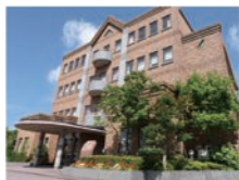
介護老人保健施設 華 〒596-0046 大阪府岸和田市藤井町2-22-10 TEL: 072-431-8791 FAX: 072-431-8705