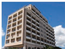
高石藤井病院 〒592-0014 大阪府高石市綾園1-14-25 TEL: 072-262-5335 FAX: 072-263-5696