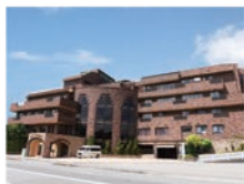
泉北藤井病院 〒590-0126 大阪府堺市南区泉田中3100-19 TEL: 072-295-8888 FAX: 072-295-8188