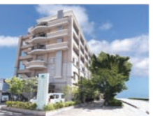
介護医療院 菜の花 〒592-0014 大阪府高石市綾園2-15-18 TEL: 072-263-6300 FAX: 072-263-6310