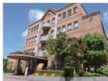
介護老人保健施設 華 〒596-0046 大阪府岸和田市藤井町2-22-20 TEL: 072-431-8791 FAX: 072-431-8705