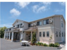
有料老人ホーム コスモスの家田尻 〒598-0091 大阪府泉南郡田尻町嘉祥寺477-1 TEL: 072-466-0601 FAX: 072-466-0576