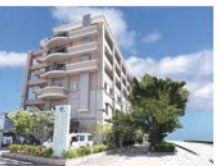
介護医療院 菜の花 〒592-0014 大阪府高石市綾園2-15-18 TEL: 072-263-6300 FAX: 072-263-6310