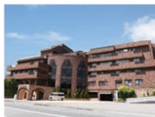
泉北藤井病院 〒590-0126 大阪府堺市南区泉田中3100-19 TEL: 072-295-8888 FAX: 072-295-8188