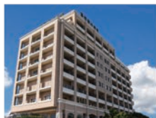
高石藤井病院 〒592-0014 大阪府高石市綾園1-14-25 TEL: 072-262-5335 FAX: 072-263-5696